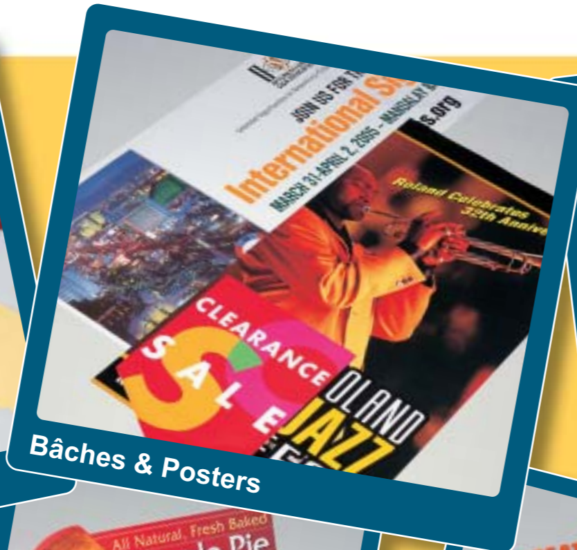
Bâches & Posters