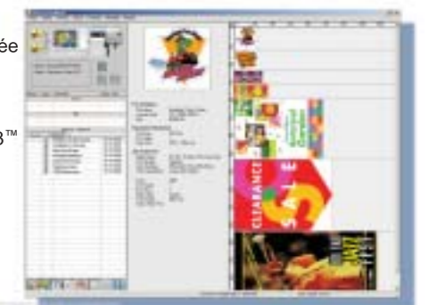
●Menu principal de VersaWorks