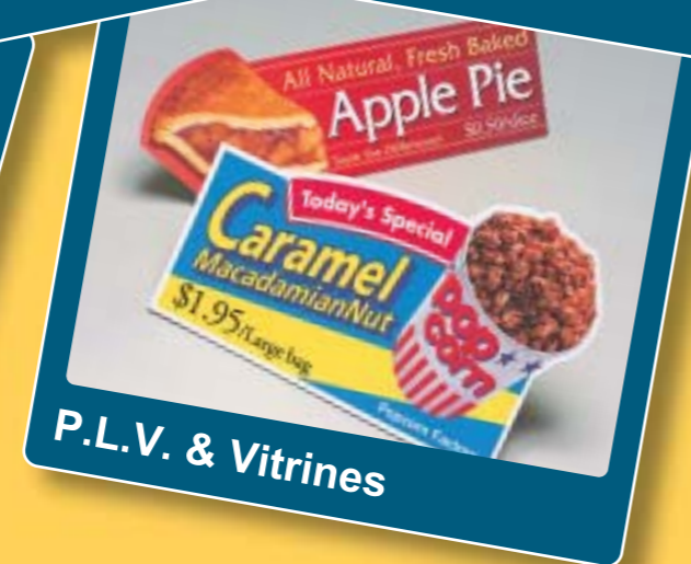
P.L.V. & Vitrines