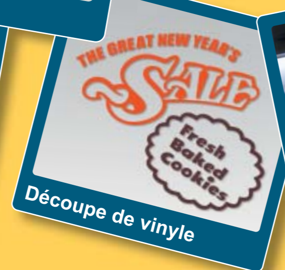
Découpe de vinyle