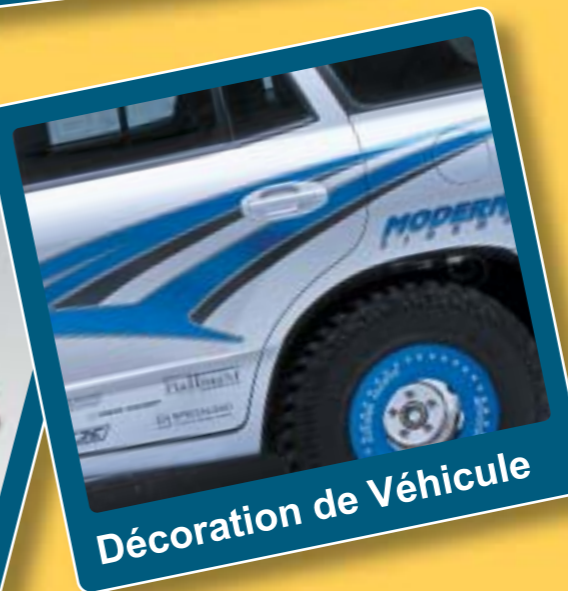
Décoration de Véhicule