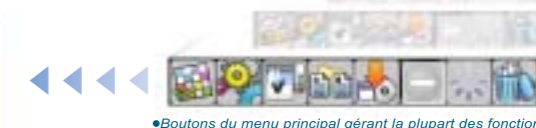
●Boutons du menu principal gérant la plupart des fonctions.