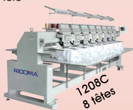
1208C 8 têtes