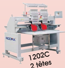
1202C 2 têtes