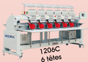
1206C 6 têtes