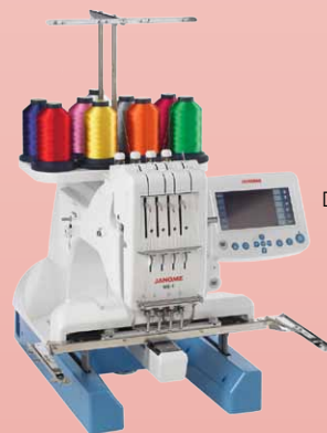
JANOME MB-4 Dimensions (L x H x P) : 36,5 x 44 x 52 cm Poids : 20,5 kg

La MB-4 est une machine à broder compacte 4 aiguilles spécialement conçue pour les petites broderies occasionnelles. Son prix d'appel permet le développement d'une activité commerciale. Ses dimensions et son poids plume sont de grands atouts pour une activité ambulante.