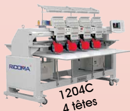
1204C 4 têtes