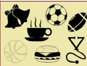
Collection de Cliparts

Cutstorm Cut comprend également des onglets de document pour faciliter la navigation entre les fichiers ouverts.