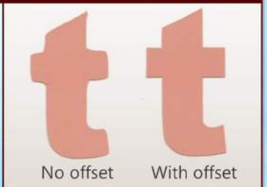
Décalage de la lame