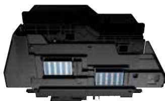
Protection de tête