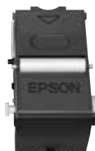
Nettoyeur à tissu