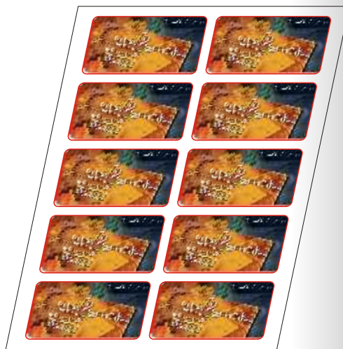
Duplication et impression des visuels sur Sublipaper ou Sublipaper Plus