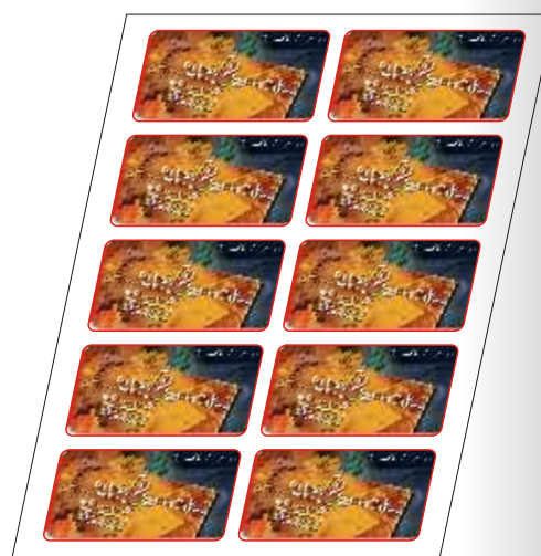
Duplication et impression des visuels sur Sublipaper ou Sublipaper Plus