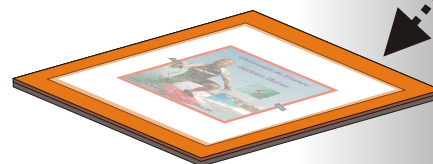
Disposition de l'ensemble sur le plateau inférieur de la presse