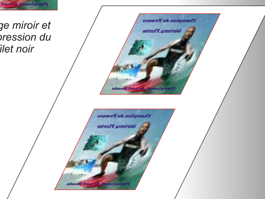
Impression du visuel sur Sublipaper ou Sublipaper Plus