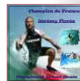
Insertion du visuel dans le gabarit