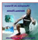
Image miroir et suppression du filet noir