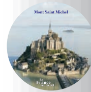
Suppression du filet noir