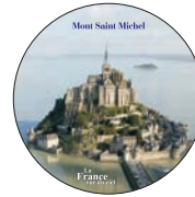
Positionnement du visuel