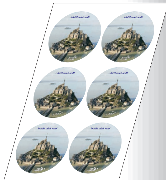
Duplication et impression des visuels sur Sublpaper ou Sublpaper Plus