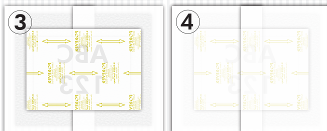
TABLEAU 1: FEUILLE B SUR FEUILLE A-FOIL