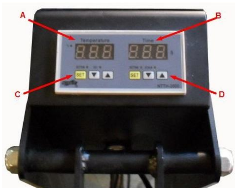
TABLEAU DE CONTRÔLE